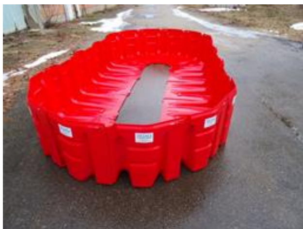
Esquina exterior 30º