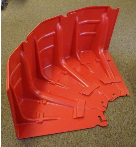
Esquina interior 30º