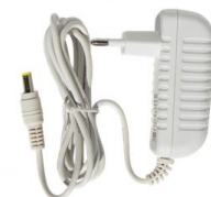
Adaptador DC 12v