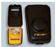
Caja de hibernación