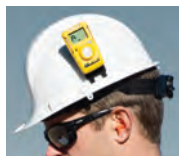
Pinza para casco