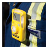
Fácil de utilizar