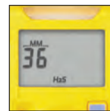
Fácil de leer