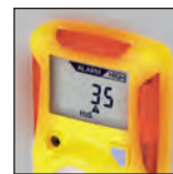
Fácil de ver